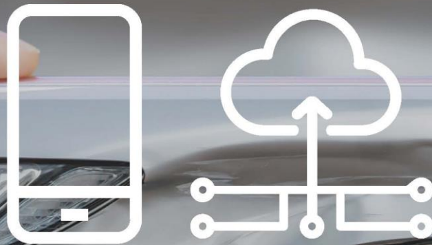
Image Forgery Detection

KI- und Cloud-basierte Betrugserkennung in der Kfz-Schadensabwicklung